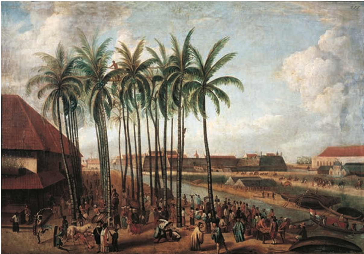
De markt van Batavia met op de achtergrond een fort. Het gebouw links is een pakhuis waar handelswaar werd opgeslagen.

Langzaam maar zeker kwamen de mensen in verzet. Ze wilden hun land zelf regeren. Er kwamen steeds meer opstanden.